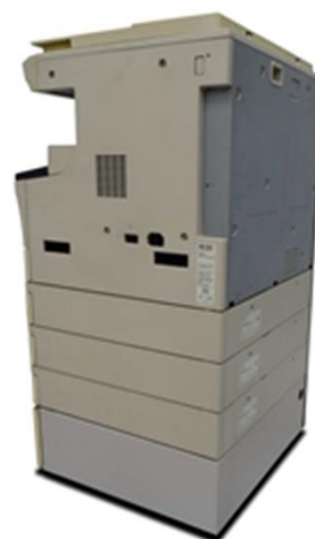
A3 Monochroma tická kopírka

Řešení: Servisní technik KYOCERA udělá příslušná protipatření. Odhadovaná doba práce: 15 minut.